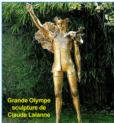
Grande Olympe sculpture de Claude Lalanne